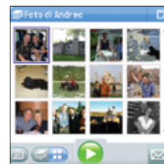
Foto e video

Potete navigare in Internet per individuare itinerari o consultare recensioni di ristoranti, programmazioni cinematografiche e risultati sportivi, ovunque vi troviate.